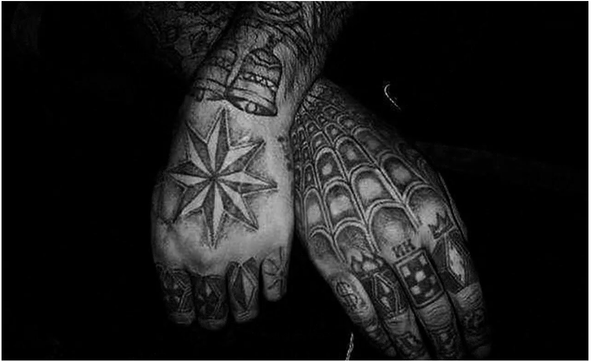
Иллюстрация 2. Примеры криминальных татуировок

Маркеры склонности к совершению акций типа «Колумбайн» 14 и (или) террористическим актам