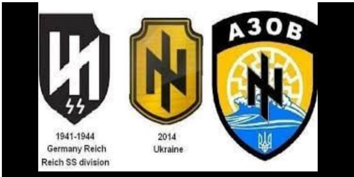
Рис. 2 Атрибутика украинских неонацистов и ее сходство с атрибутикой немецких нацистов прошлого века.